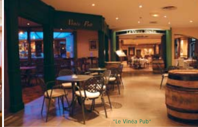
"Le Vinéa Pub"