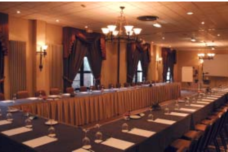
Salle de Réunions / Meeting Room

No matter where you are, at the Holiday Inn you can rely on our friendly "Can-do" service and the highest standards of comfort and quality. With the guarantee of a great night sleep, our extensive breakfast buffet and our rewarding loyalty programme the Holiday Inn is the natural choice for guests.