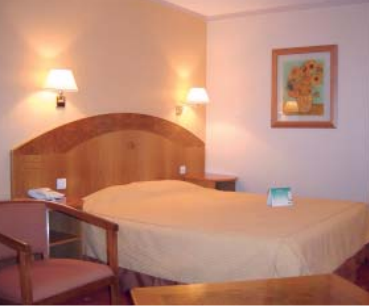
Chambre / Bedroom