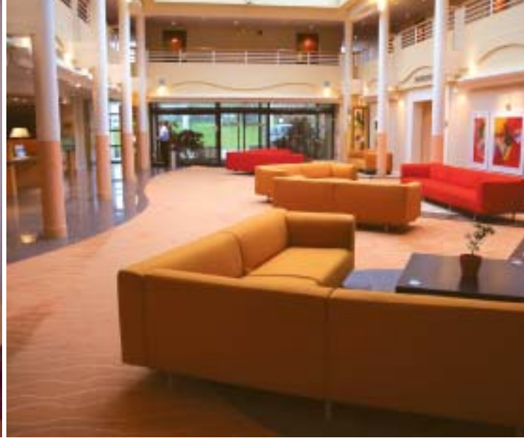
Hall / Lobby