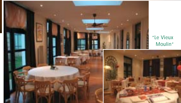
"Le Vieux Moulin"