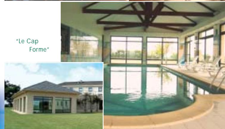
"Le Cap Forme"